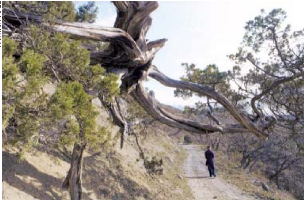
Один из 500-летних можжевельников растет на заброшенной дороге близ Батилимана