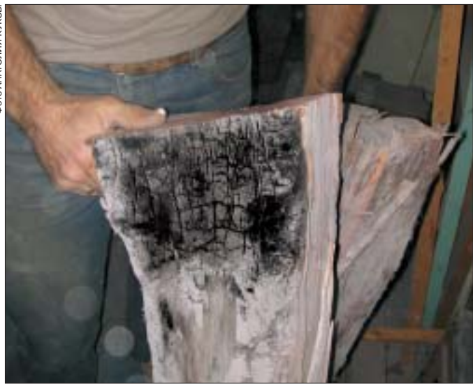
По словам мастера-краснодеревщика Василия Я., он использует можжевельник, вырубленный на пожарище

складе в Севастополе стоит 450 долларов, ясеня — 380 долларов, сосны — 250 долларов).